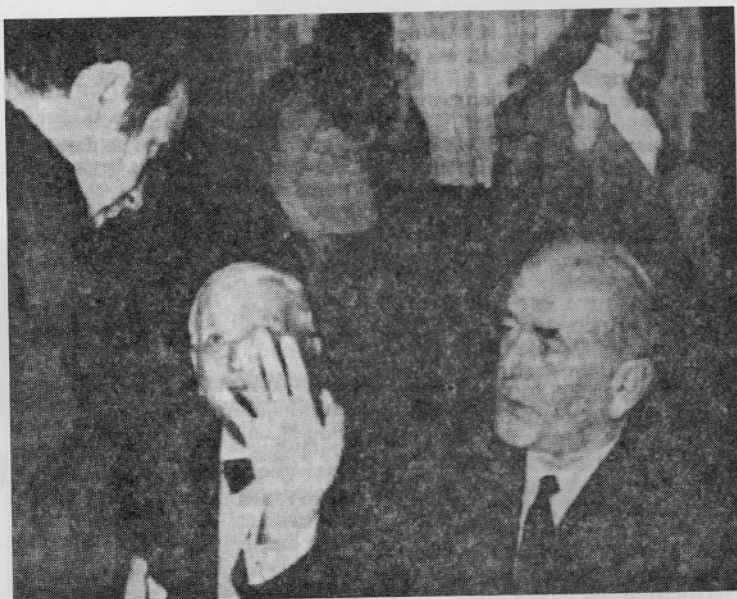
Rüstungsminister a.D. Albert Speer im Schwurgerichtssaal Hannover, Jan. 1971