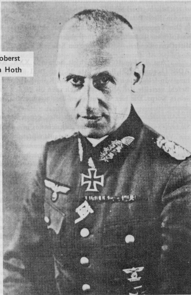
Generaloberst Hermann Hoth