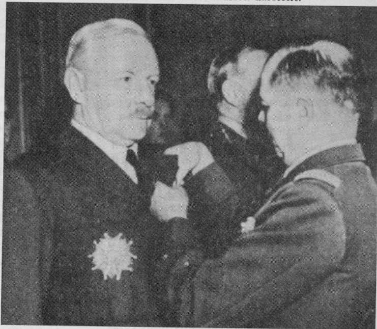
Verantwortlicher für den zivilen Massenmord: Luftmarschall Sir Arthur Harris: wurde Großoffizier der Ehrenlegion. – Ein Kriegsverbrecherprozeß wäre angebracht gewesen.

REINECKE: Die Auswertung ist unter meiner Leitung vorgenommen worden von 15 zum Richteramt befähigten SS-Interneen. Ausgewertet wurden ca. 170.000 eingereichte Erklärungen. Davon sind 136.213 eidesstattliche Versicherungen und Zeugenschaftsanträge zu einer Dokumentensammlung zusammengestellt worden. Der Rest sind bloße Bitten um Vernehmung und so weiter. Diese 136.000 Erklärungen sind in der zusammengestellten Dokumentenmappe aufgeteilt in verschiedene Teilgebiete, die die Beantwortung der Fragen der Verteidigung von gegen die SS erhobenen Vorwürfen darstellt.