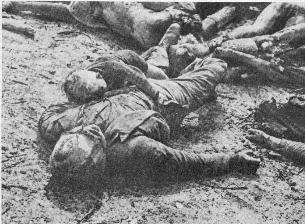
Nachgewiesene Ermordete des zivilen Bombenkrieges – hier in Kassel, Beispiel für tausende –

F.: Ich frage Sie über den SD, angenommen, daß dieser die