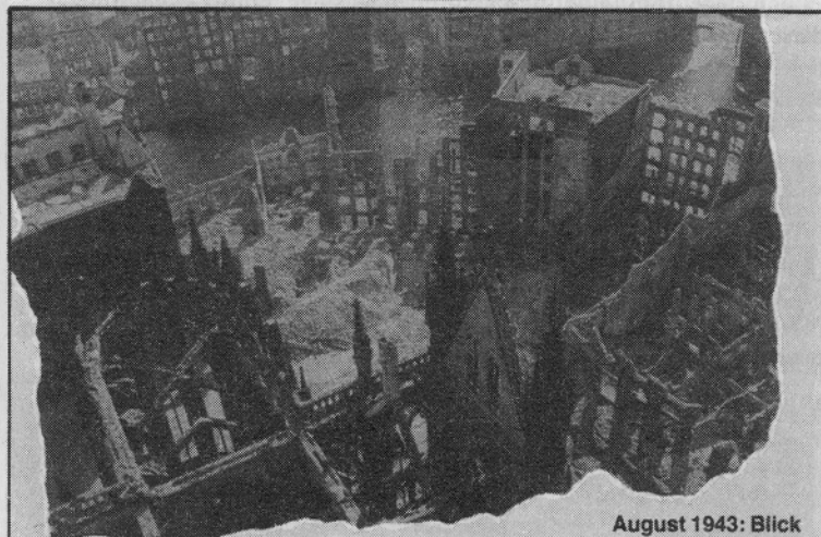
August 1943: Blick von der Nicolai-Kirche