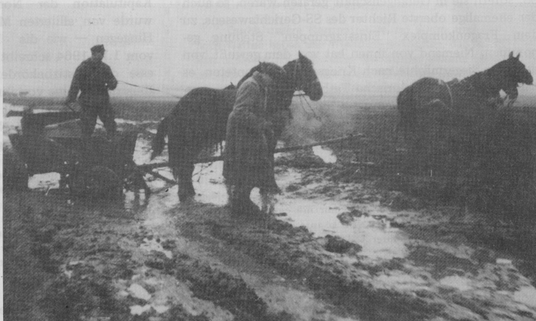
Vielfach tägliche Verhältnisse in Rußland, denen auch die Einsatzgruppen gegenüberstanden

VON MANSTEIN: Bei der Unterstellung, überhaupt bei jeder militärischen Unterstellung, unterscheidet man entweder eine taktische Unterstellung — das ist die Unterstellung für den Kampf an der Front — oder eine wirtschaftliche Unterstellung — das ist die Unterstellung für die Versorgung mit Verpflegung, mit Betriebsstoff und die Unterbringung —, drittens eine truppendienstliche Unterstellung — das heißt also die Unterstellung für die Ausbildung, für die Ausrüstung, in Personalfragen: disziplinar und gerichtlich. Diese letztere truppendienstliche Unterstellung ist uns nie, in keinem Falle — selbst nicht für die Verbände der Waffen-SS — zugebilligt worden. Wirtschaftlich und taktisch, das heißt für den Kampf, war eine solche Unterstellung möglich. Der