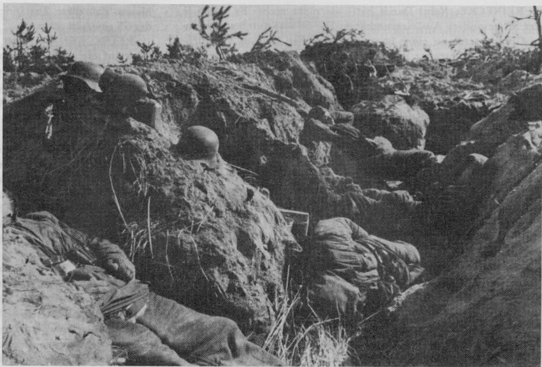
Alltag des deutschen Landsers in Rußland

REINECKE: Es kam daher, daß das Gerichtswesen früher keinen Verdacht geschöpft hatte, und dies begründet sich wieder darin, daß diese Gerichtsoffiziere während der Jahre 1943 fortlaufend solche Tatberichte bei den Gerichten eingereicht hatten. Diese Tatberichte waren sehr exakt ausgearbeitet. Es befanden sich bei den unnatürlichen Todesfällen von Häftlingen darin Lichtbilder des Tatortes, des Toten, ärztliche Untersuchungsergebnisse, Zeugenaussagen von Häftlingen und Wachmannschaften. Diese Arbeit war so exakt, daß nicht der Verdacht entstehen konnte, daß hier auch hinter dem Rücken der Gerichts-