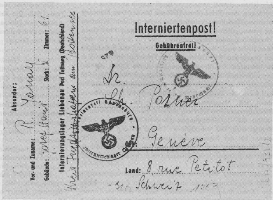
Postkarte eines im Arbeitslager Liebenau (Süddeutschland) internierten polnischen Juden an den Kodirektor des Genfer Palästinabüros; der Absender bittet um die Ausstellung eines Palästina-Zertifikats für seine vierjährige Tochter, deren Fotografie er auf die Rückseite der Karte geklebt hatte. Die Karte trägt sowohl den Stempel der Lagerverwaltung als auch den des deutschen Zensors.