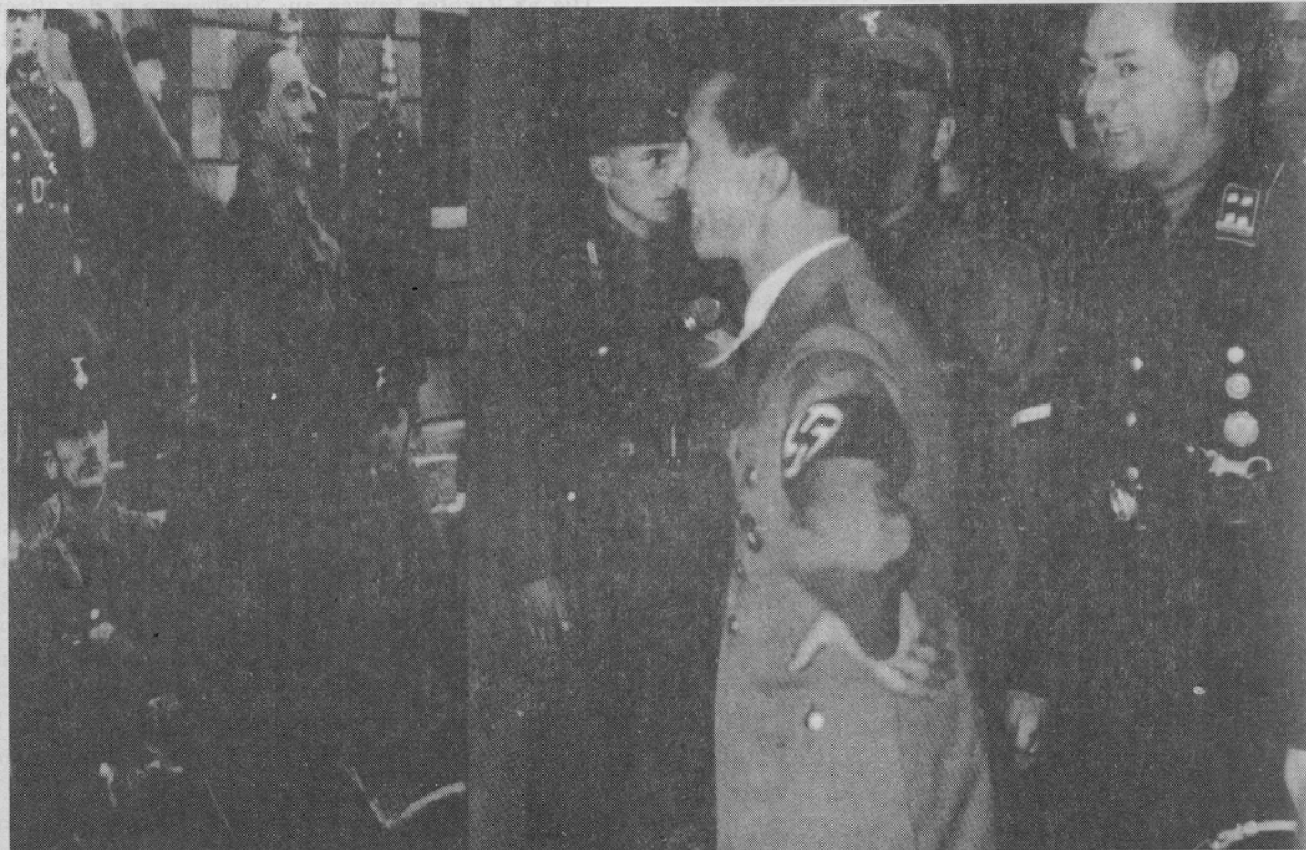
Dr. Joseph Goebbels, Reichsminister für Volksaufklärung und Propaganda, anlässlich einer Ausstellung, in der ein Foto seines Auftretens im Wahlkampf 1931 zu sehen ist, galt für Sefton Delmer, Schwarzmeister seiner Majestät von Großbritannien, als "Propagandazwerg". Er freilich muß es beurteilen können.