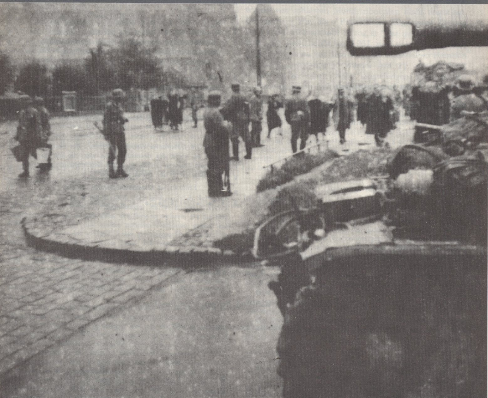
Kampfszene im Warschauer Aufstand, August 1944